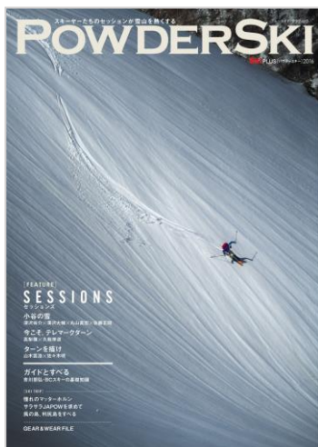
＜＊昨季版表紙イメージ＞